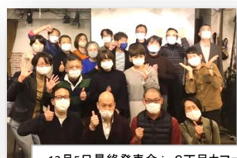
12月5日最終発表会 in 3丁目カフェ

セカンドキャリア地域起業セミナー第3期 (9月26日～10月31日全6回+12月5日最終発表会) プロボノ実践講座【実践編】(9月～12月+12月5日最終発表会) トークイベント田園都市で暮らす働くを語ろう 「準工業地帯発、地域子育てと場づくり」(2月2日) あおば地域起業相談室(計3回)