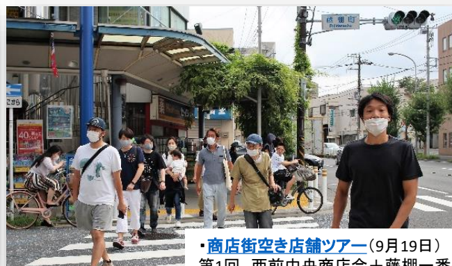
・商店街空き店舗ツアー(9月19日) 第1回 西前中央商店街+藤棚一番街