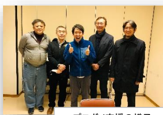
プロボノ支援の様子