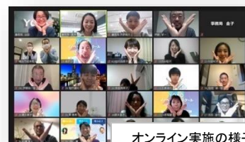
オンライン実施の様子

全編オンラインで実施。横浜のみならず全国より受講生が集まりました。また、対面実施では参加が難しい子育て層なども受講。多様な起業家コミュニティが形成されました。